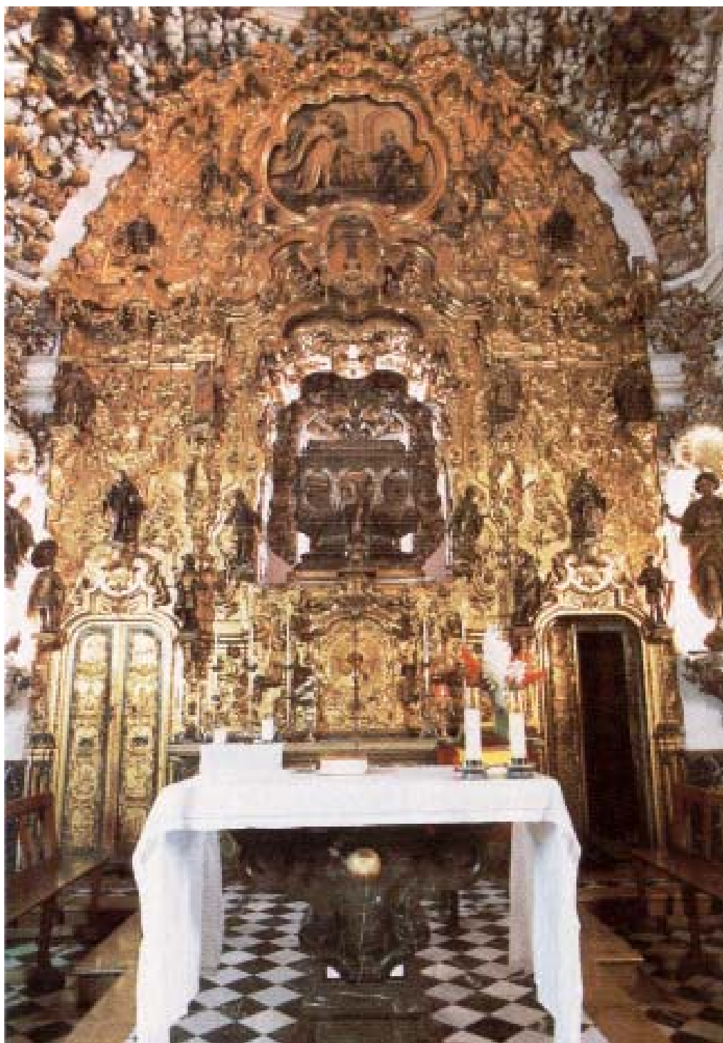
Capilla del Sagrario de la Parroquia de San Pedro, construida en el siglo XVIII por la Hermandad del Santísimo Sacramento y Santos Mártires. En el centro, la urna con las sagradas reliquias.