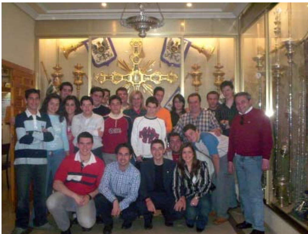
Jóvenes de varias hermandades cordobesas durante en encuentro organizado por la Agrupación de cofradías en nuestra casa de hermandad.