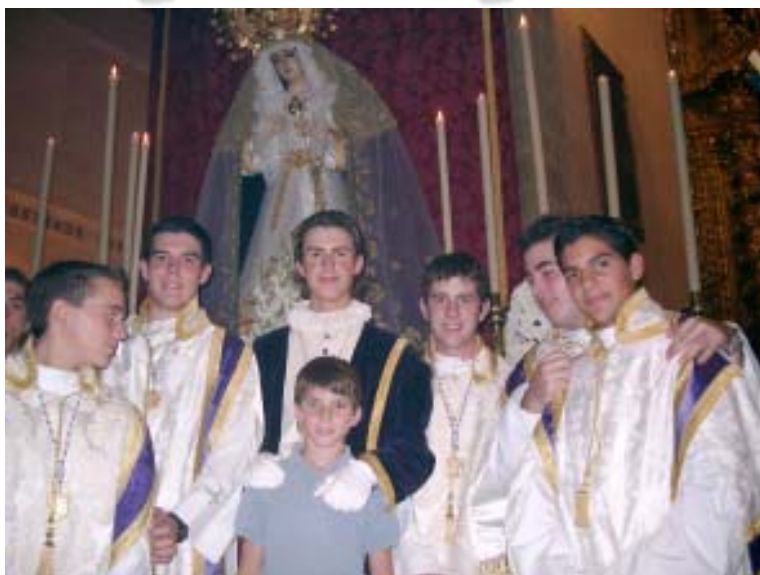
Grupo de acólitos de nuestra hermandad tras la función en honor de Nuestra Señora de las Lágrimas en su Desamparo, celebrada el pasado 15 de septiembre

Todos los viernes a partir de las 8.30 de la tarde, el Grupo Joven se reúne en la casa de hermandad: participa tú también de los diversos proyectos y actividades