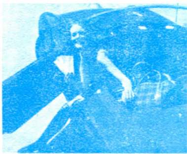
CHEQUES DE VIAJE