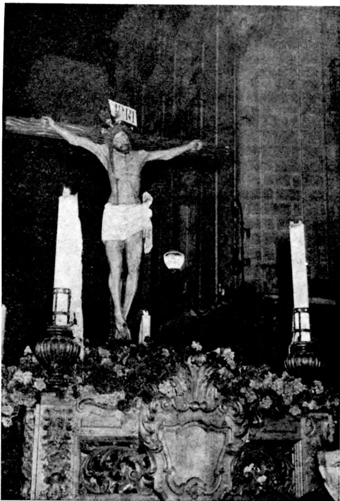
Santísimo Cristo de las Penas