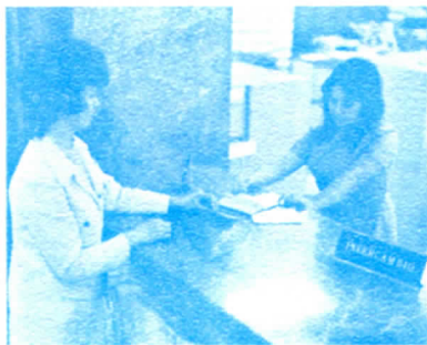
SERVICIO DE INTERCAMBIOS