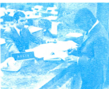
ASESORAMIENTO DE INVERSIONES