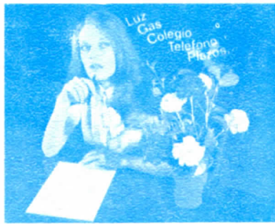
DOMICILIACION DE PAGOS