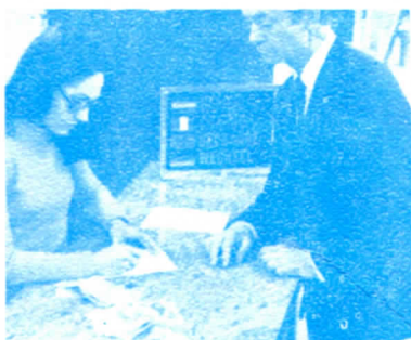
CAMBIO DE DIVISAS