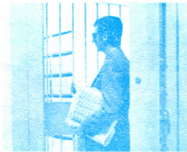
COMPRA, VENTA Y CUSTODIA DE VALORES